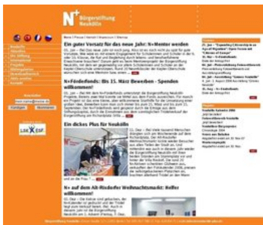
Die Startseite von N+

10. Jan 2008 (dw) – Gutes zu tun, ist eine Sache, Gutes zu bewirken eine andere. Dabei kann eigentlich jeder Wirkung befördern - etwa durch